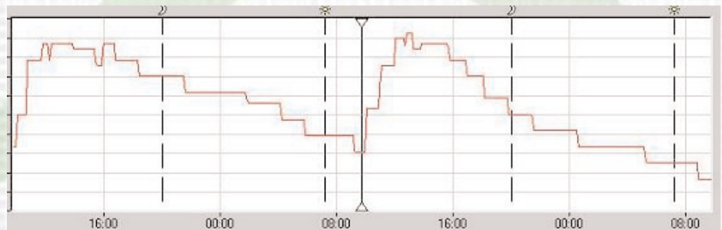
Het verloop van het matgewicht gedurende twee dagen, uitgezet in grafiekvorm

Voor meer informatie kunt u contact opnemen met HortiMaX +31 (0)15 362 03 00 of met een van onze dealers in uw omgeving. Kijk ook op www.hortimax.nl